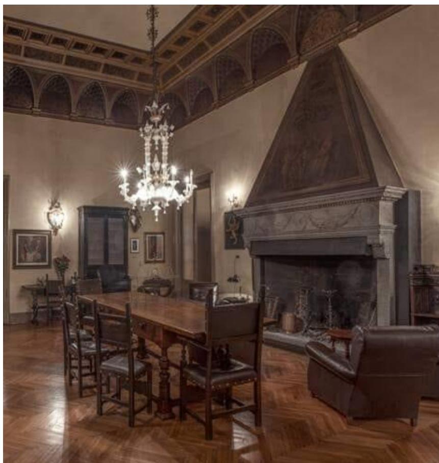
Palazzo Sersanti – Sala del camino

Palazzo Sersanti - Piazza Matteotti n. 8 - 40026 Imola (BO) - Telefono 0542 26606 Cod. fiscale 00467050373 - Registro Persone Giuridiche Prefettura di Bologna n. 62, pag. 104, vol. 1 e-mail: segreteria@fondazionekrimola.it - web: www.fondazionekrimola.it