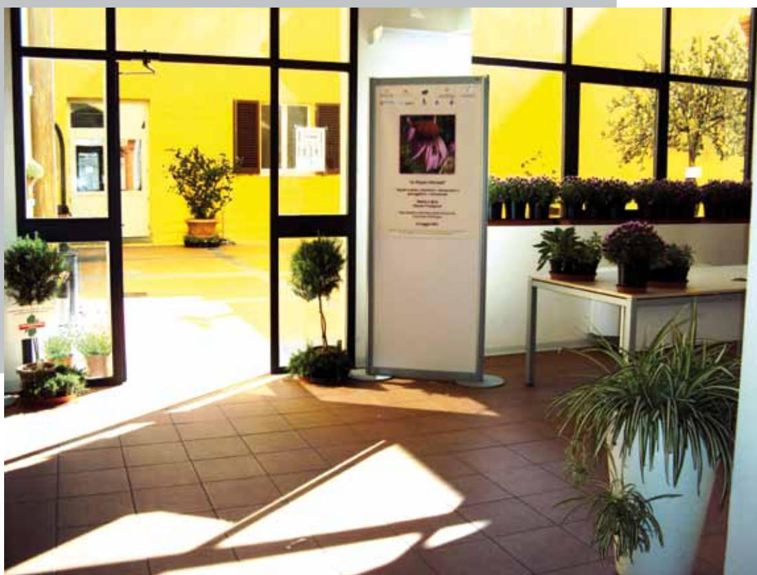
Ingresso di Palazzo Vespignani

Nel 2011 la Fondazione appoggerà il Corso di Laurea triennale in Verde ornamentale e Tutela del Paesaggio , istituito nel settembre 2002 dalla Fa-