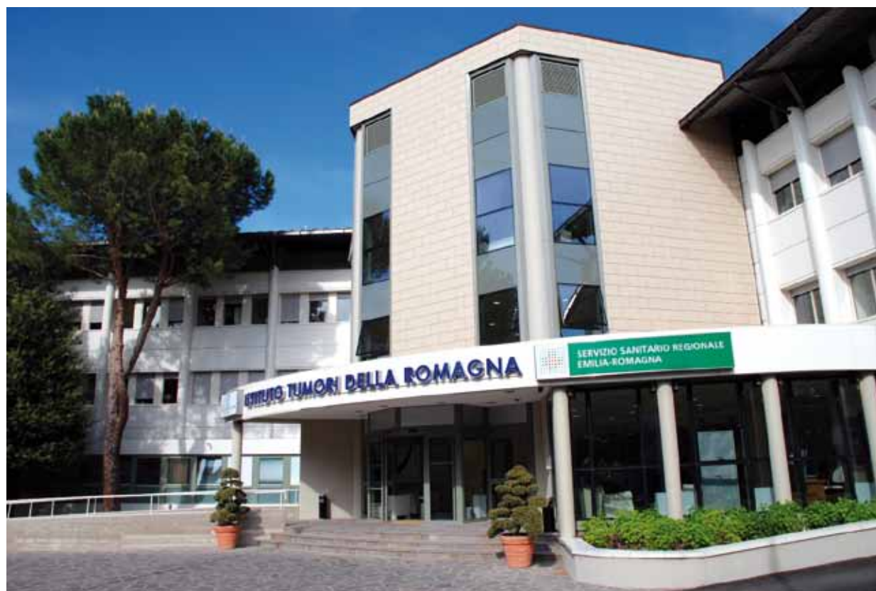
Ospedale I.R.S.T. di Meldola.

Un progetto di durata quadriennale, per la quale è prevista una spesa complessiva di circa 400.000 euro a carico della Fondazione. Nel 2011 si prevede uno stanziamento di 100.000 euro .