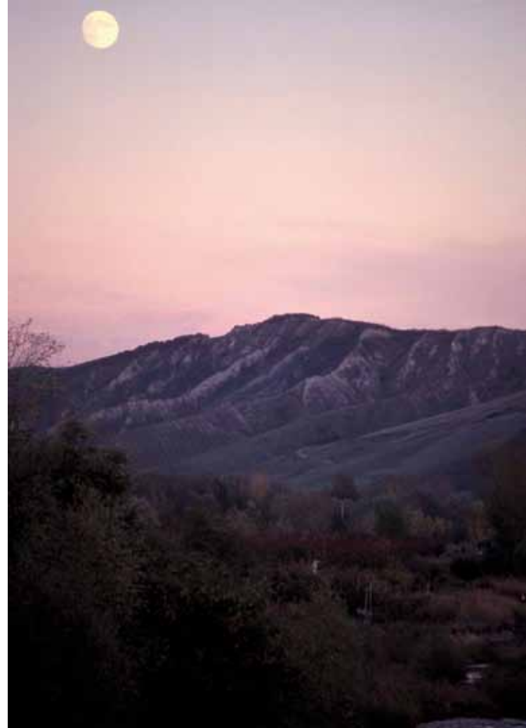
Valle del Santerno.

L'arte, l'attività e i beni culturali sono infine l'ultimo dei nostri settori rilevanti di intervento. Per beni culturali intendiamo quelle testimonianze storiche e artistiche che valorizzano il nostro territorio e che, lasciateci in eredità dai nostri avi, dobbiamo tutelare e valorizzare. Per il 2011 una serie di interventi conservativi e di restauro interesserà alcuni edifici di culto del centro storico; in partico-