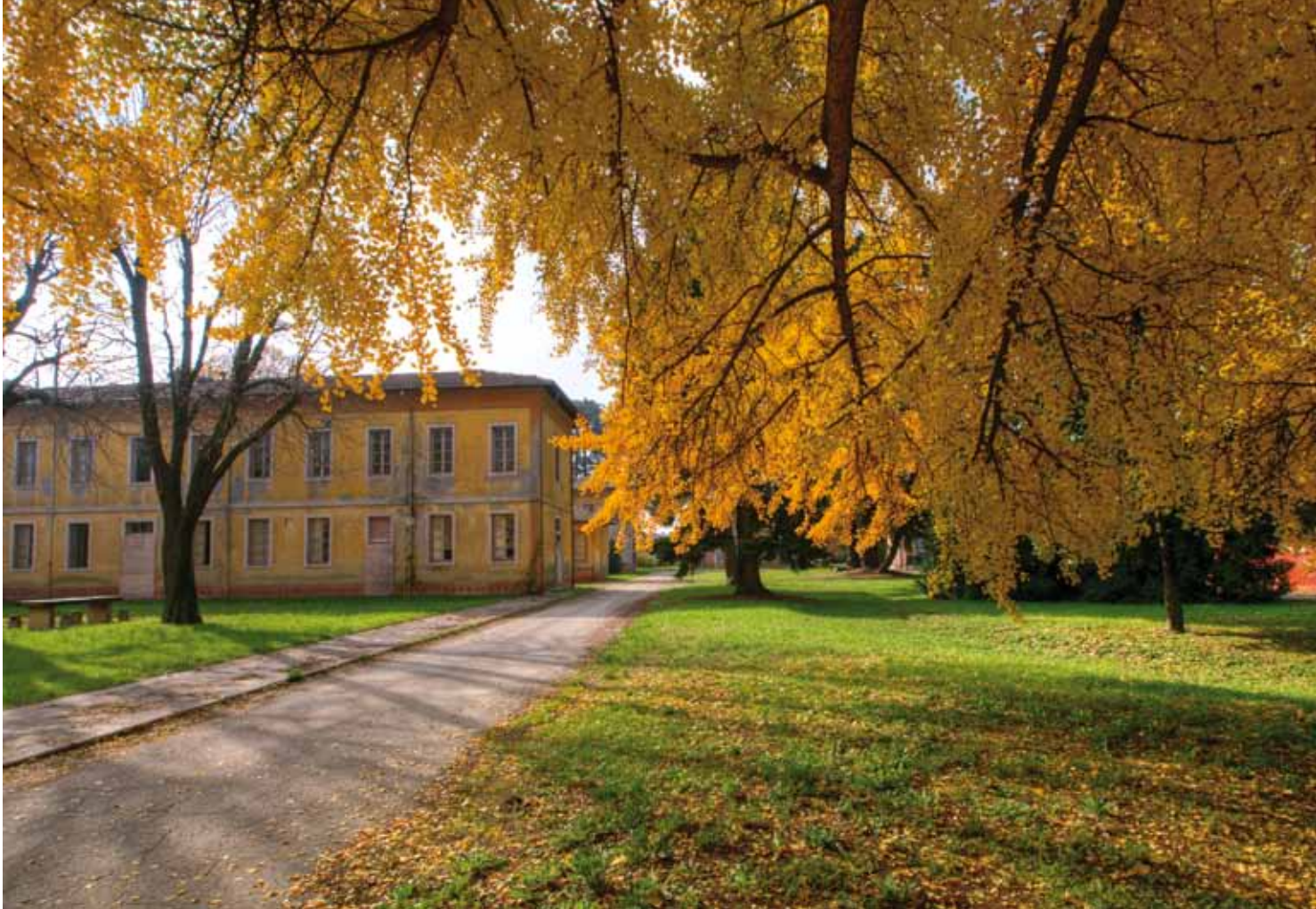
Ex manicomio dell'Osservanza.