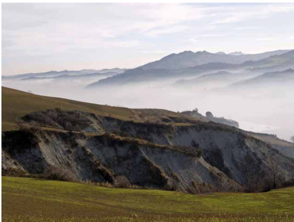
Valle del Santerno.

Come si vede dalla tabella pubblicata nella quarta pagina ove sono riportati i valori di riferimento per le erogazioni del 2011, il totale di oltre 4 milioni e mezzo di euro è, per oltre il 50% distribuito sui tre settori rilevanti di intervento individuati dalla no-