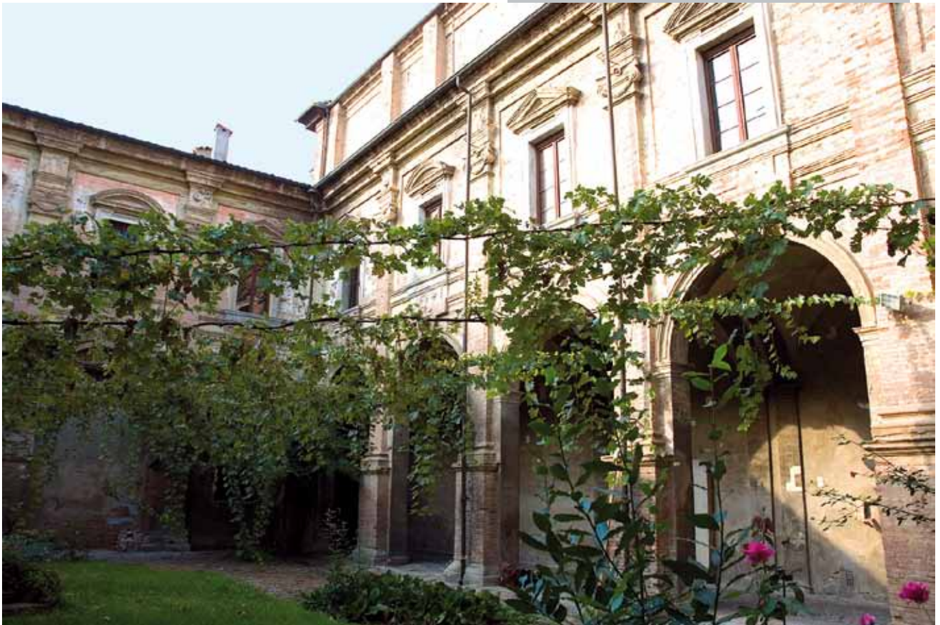
Chiostro di Santa Maria in Regola.

Sono previsti inoltre 100.000 euro alla Caritas Diocesana per la sua attività determinante in questo particolare momento di crisi economica.