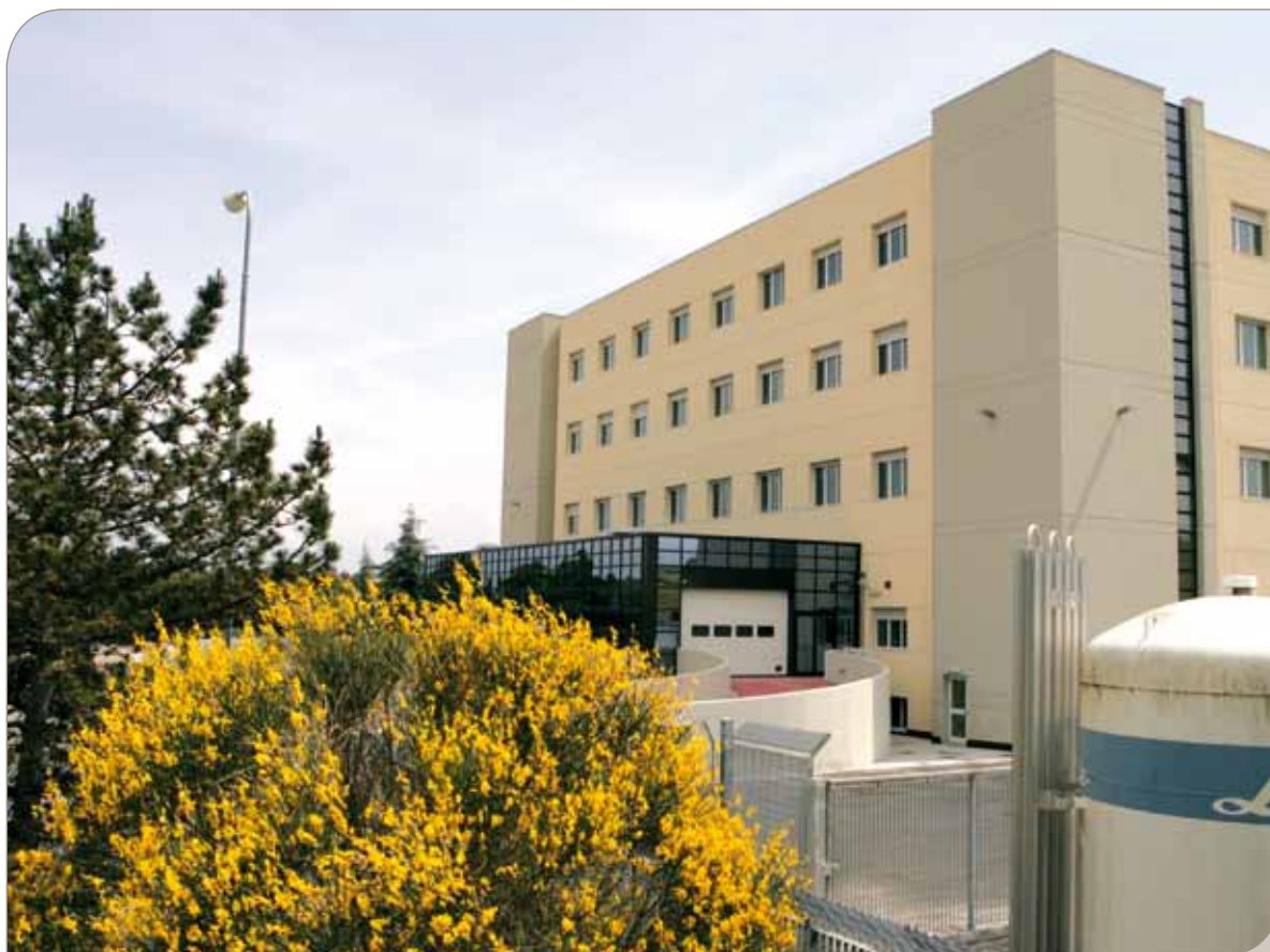
Il nuovo DEA

L'apertura del nuovo dipartimento, oltre a garantire la diminuzione delle liste d'attesa, un'alta disponibilità tecnologica ed una innovativa assistenza tecnica accompagnata sempre da una qualificata presenza umana, porterà ad un consequenziale miglioramento complessivo dell'offerta assistenziale del complesso ospedaliero di Santa Maria