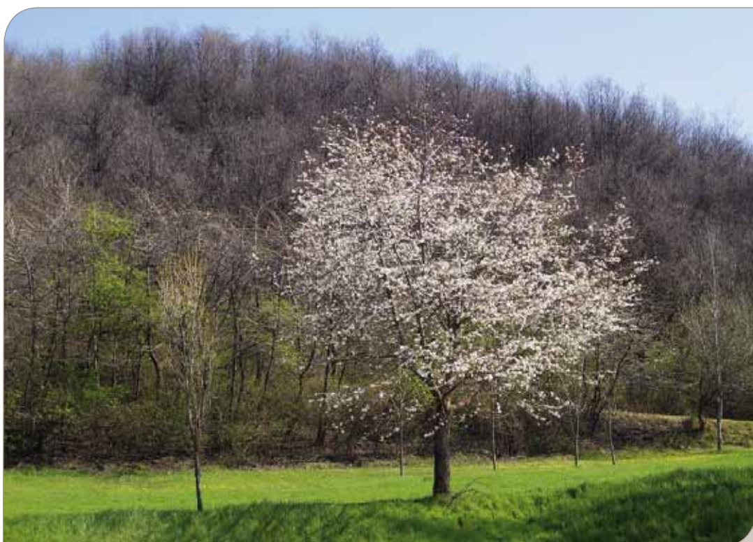
Vallata del Santerno

La nostra posizione, in situazioni come questa, deve rimanere inalterata, ossia essere quella che ci ha sempre visti presenti all'interno di un continuum storico economico le cui origini, ormai lontane, sono da trovare in istituzioni quali il Monte di Pietà e la Cassa di Risparmio di Imola. Rite-