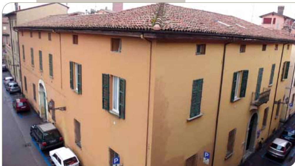
Palazzo Dal Pero

Di impianto cinquecentesco è costruito interamente in muratura di mattoni mentre le coperture sono in parte in volte e in parte in solai in legno. Il collegamento ai piani avviene a mezzo di una scala principale che dalla cantina raggiunge il sottotetto; un'altra scala di dimensioni più piccole posta nella parte Nord collega tutti i piani.