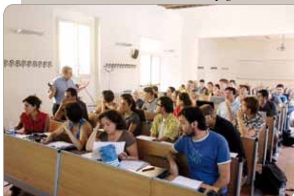
Studenti universitari a Palazzo Vespignani