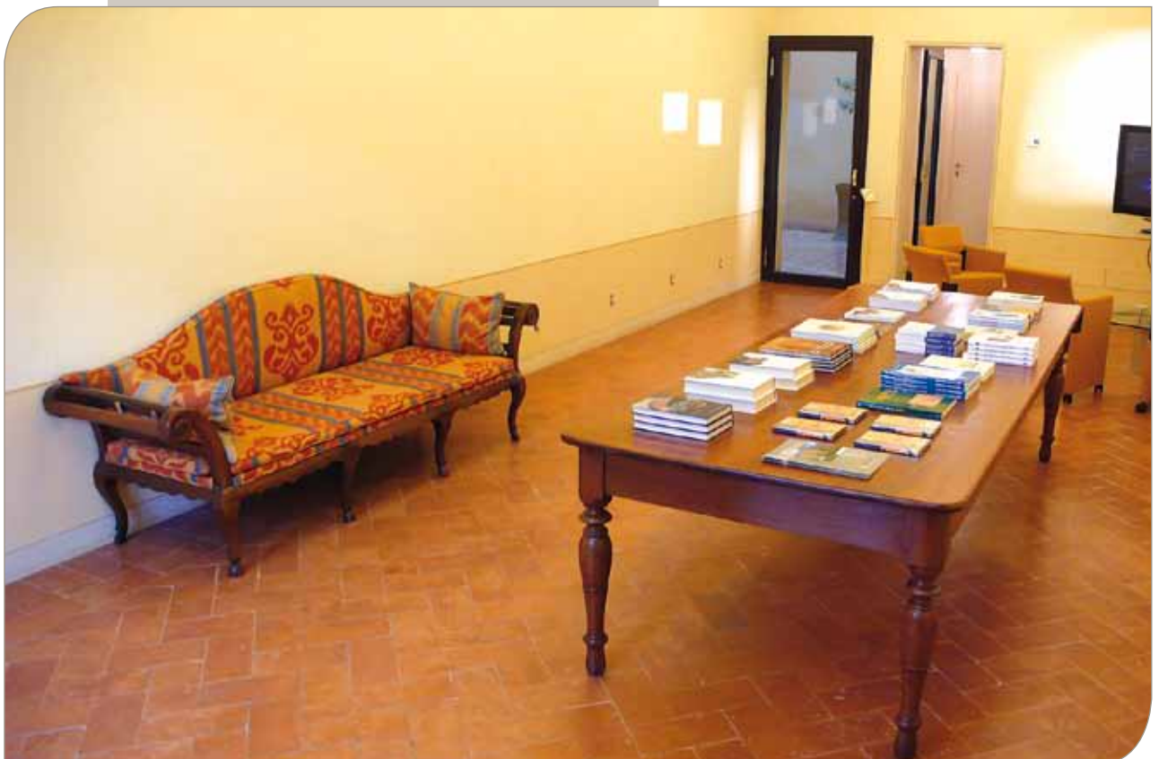
Sala Polivalente "Gianni Isola"

Oltre 450 sono stati i volumi distribuiti in omaggio in queste giornate.