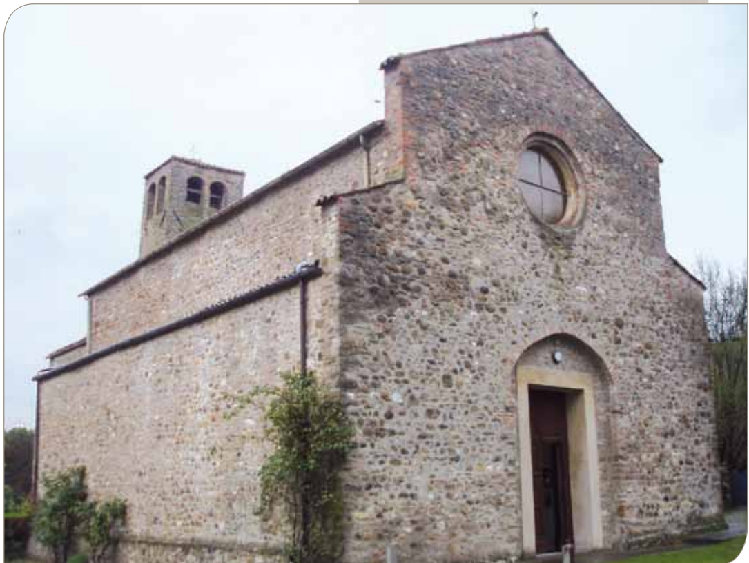
Chiesa della Visitazione della Beata Vergine in località Riviera

Concorso Teatrale Femminile "La Parola e il Gesto - Premio Fondazione Cassa di Risparmio di Imola" XIV edizione.