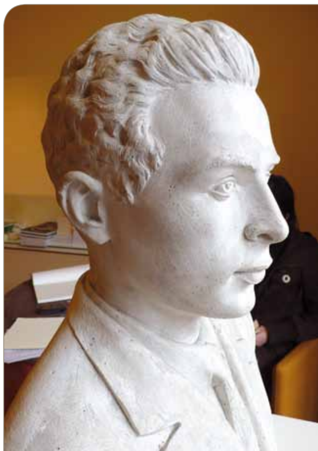
Busto di Giuseppe Fanin

L'allestimento, curato dalla Associazione ex allievi, ha dato occasione di poter vedere tanti importanti documenti non solo personali di Giuseppe Fanin, ma più generali e utili per la ricostruzione storica di quel travagliato dopoguerra di cui Fanin fu protagonista e, suo malgrado, vittima simbolica. La mostra ha avuto un buon afflusso di pubblico, e ha visto la presenza tra gli altri, di Mons. Ghirelli, Vescovo di Imola e dei parenti del Fanin.